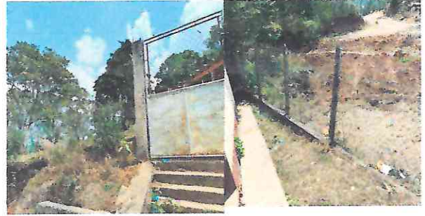
Foto 4: Muro Perimetral en mal estado, y porton necesita mantenimiento.