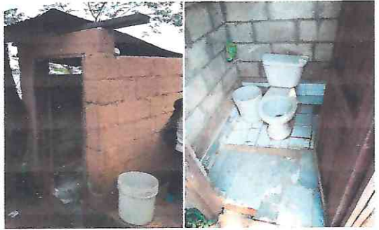
Foto 6: techo del servicio sanitario deteriorado, e inodoro en malas condiciones.

Observación: Si es necesario se pueden agregar hojas adicionales y actualizar el número de hojas.