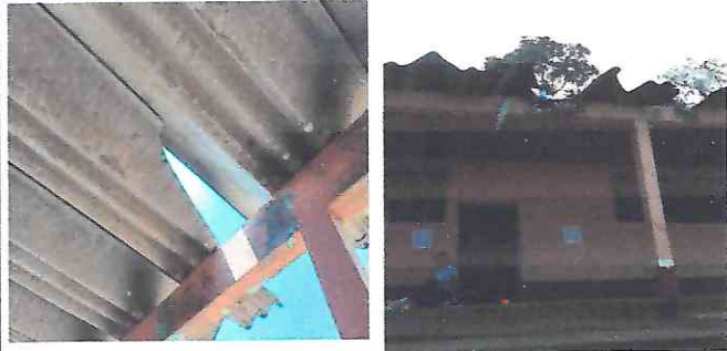
Foto1: Laminas de fibrocemento en muy malas condiciones.